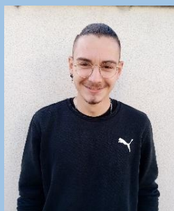
Louis Cornuault : accueil périscolaire, accueil de loisirs et restaurant scolaire