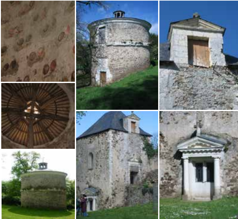
La chapelle, les douves, le chemin de ronde et le pigeonnier sont inscrits aux monuments historiques depuis 1941.