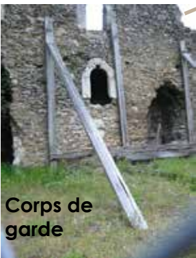
Corps de garde