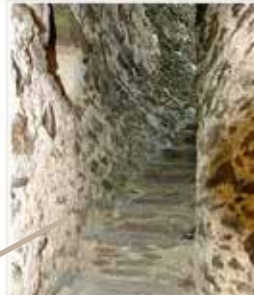
Escalier menant aux salles basses (cuisine, office ...)