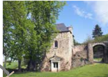
Pont-levis XIXe siècle remplaçant l'ancien pont-levis