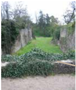
Douves remblayées au XIXe