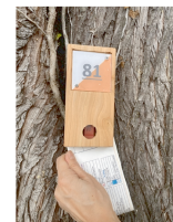
Balise à trouver et à poinçonner